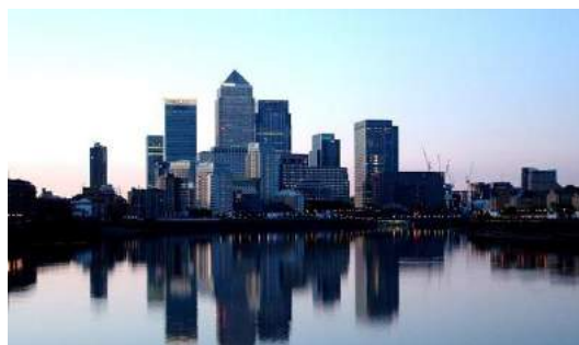
London Docklands. Лондон Площадь редевелопмента: 421 га Общая площадь объектов: 366 тыс. кв.м офисных площадей и 2600 жилых домов