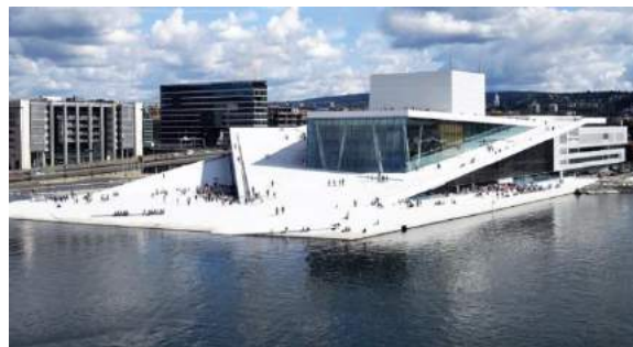
Fjord City. Осло Площадь редевелопмента: 225 га Общая площадь объектов: 2 млн.кв.м