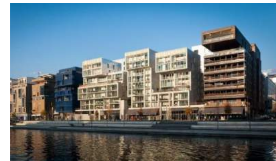
Confluence Lyon. Лион Площадь редевелопмента: 150 га Общая площадь объектов: 420 тыс.кв.м.