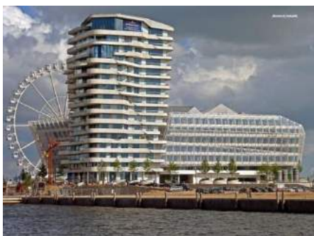
HafenCity. Гамбург Площадь редевелопмента: 155 га Общая площадь объектов: 1,10 млн кв.м