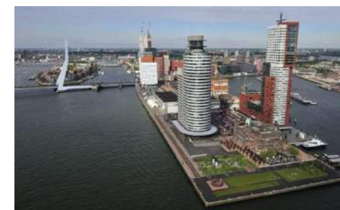
Kop Van Zuid. Роттердам Площадь редевелопмента: 125 га Общая площадь объектов: 400 тыс. кв.м. офисных площадей и 5.300 юнитов