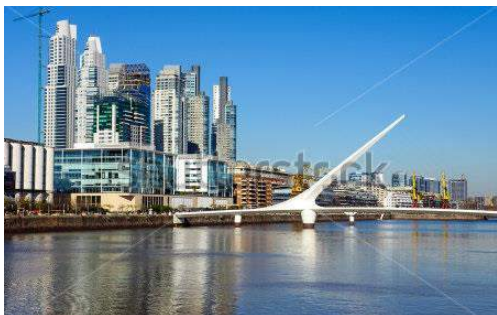
Puerto Madera. Буэнос-Айрес Площадь редевелопмента: 170 га Общая площадь объектов: 1,5 млн кв. м